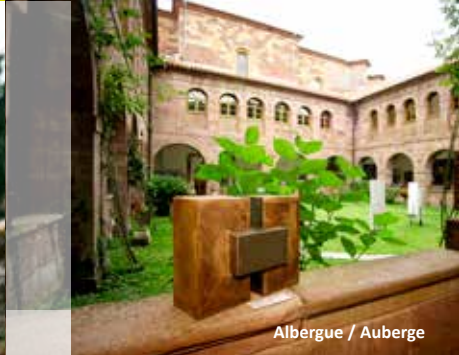
Albergue / Auberge