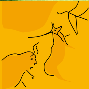
Pic-nic / Bar IKABURU

Les grottes d'Urdax ont été habitées par nos ancêtres à différentes périodes du Paléolithique et du Mésolithique. Le célèbre spéléologue français Norbert Casteret découvrit en 1930 « un magnifique abri sous les rochers », Berroberria , et « une grotte avec des gravures », Alkerdi . La grotte d'Alkerdi abrite, au fond d'un couloir, des gravures réalisées sur une stalagmitique. Elles représentent un bison et un cerf et probablement aussi un cheval, et elles remonteraient au Magdalénien supérieur, il y a environ 13.000 ans. Il est cependant impossible, actuellement, de contempler ces dessins, pour des raisons de conservation.